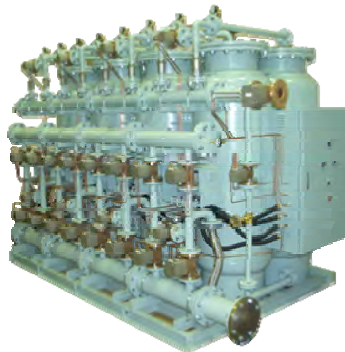
参考写真 TZM754-4300Eco （99.99%、300Nm 3 /h）