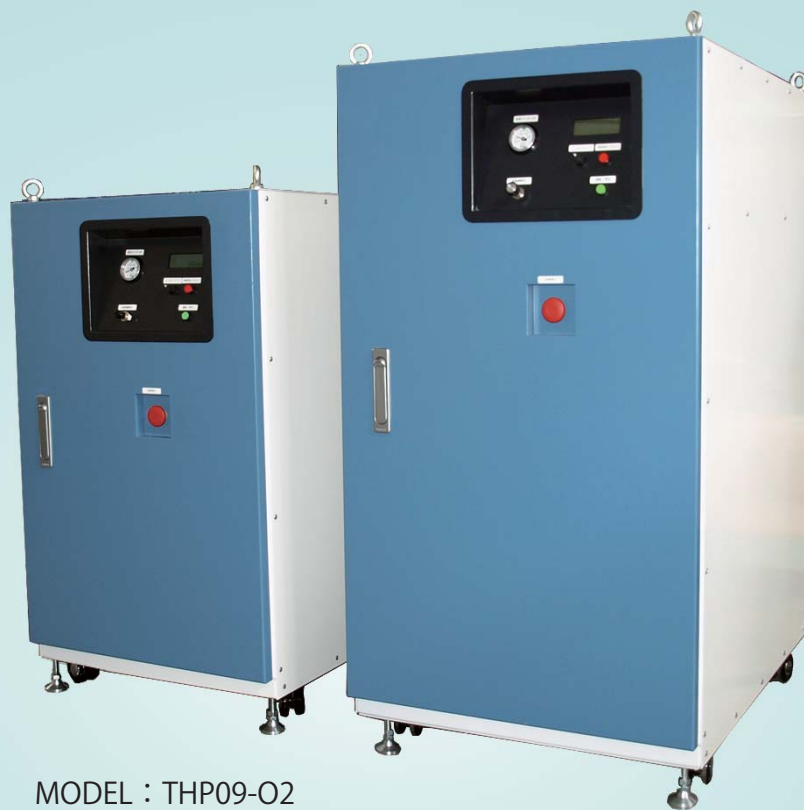
MODEL : THP09-02 (0.75kW 内蔵)